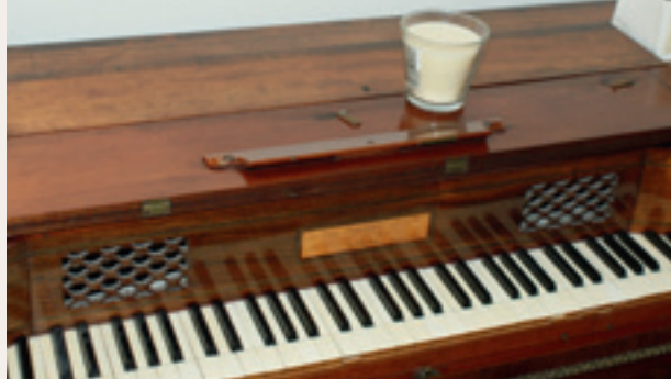
Een historische Broadwood tafelpiano. Ook gekocht als restauratie object, maar nu een sierstuk in de showroom

superieure kwaliteit en werken we met professioneel opgeleide mensen, waarin we het volste vertrouwen hebben. Wederzijds vertrouwen en respect is voor ons het allerbelangrijkste in de omgang met klanten en medewerkers. Zij maken het bedrijf.” Inmiddels telt JS Piano’s al tien medewerkers, die regelmatig de gelegenheid krijgen om zich bij te scholen. “We zorgen er voor het persoonlijk contact met de klanten niet te verliezen. Daarom beperken we de tijd op kantoor tot een minimum en gaan we ook zelf dagelijks de weg op.”