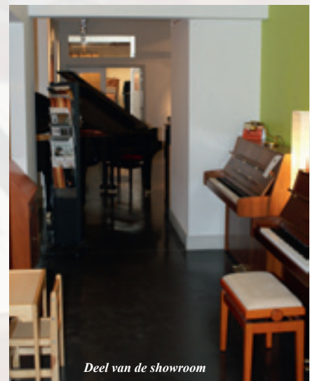
Deel van de showroom